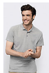
SOL'S SPRING II 11362