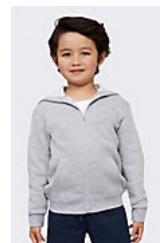
SOL'S STONE KIDS 02092